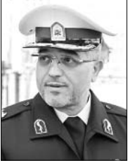
سردار حسینی، رئیس پلیس راهور فراجا

عضو هیات علمی دانشگاه صنعتی امیرکبیر، معتقد است: «اگر سه مولفه اعمال قانون مکانیزه، اعمال قانون گسترده و پرداخت جرایم با یک مکانیزم مشخص در