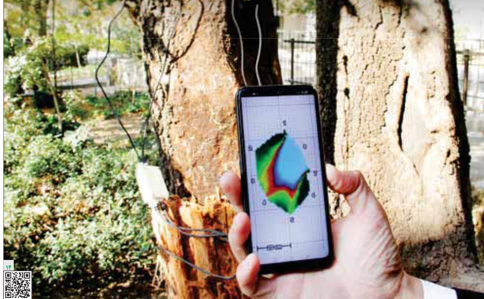
با اسکن این گیاه که گویا که گرامی دربار تیمار درختان تهران بسیند.

بیماری درختان کهنسال همه مناطق تهران با اسکن شناسایی می شوند