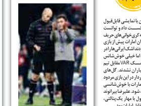
تیم ملی ایران با نامشروع قابل قبول امارات را شکست داد و توانست...