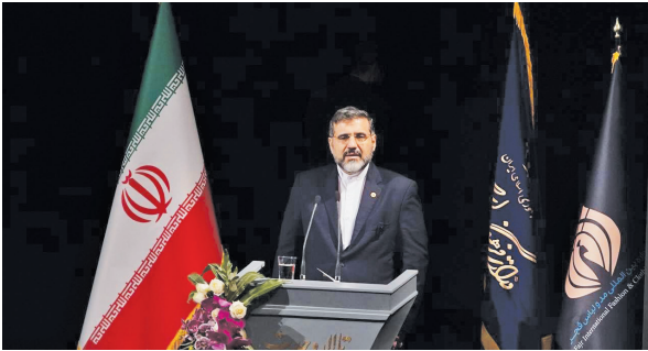
وزیر ارشاد در مراسم افتتاحیه جشنواره مد و لباس فجر ۱۴۰۲