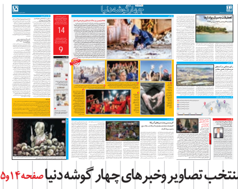
منتخب تصاویر و خبرهای چهار گوشه دنیا صفحه ۱۴ و ۱۵