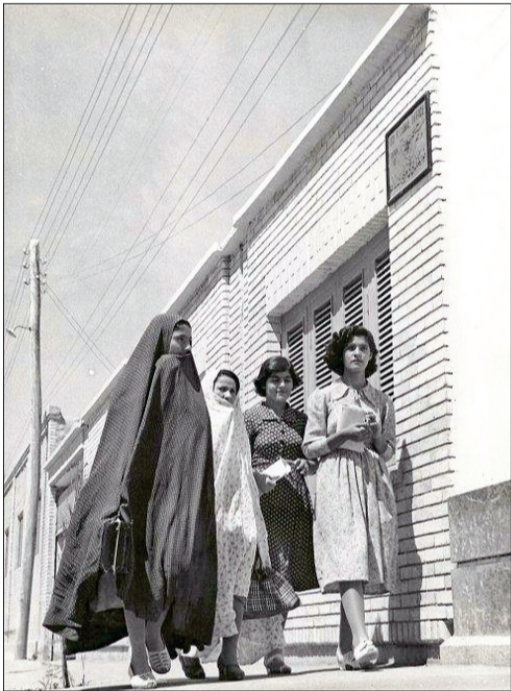
قاب نوستالژی ۳ زندگی روزمره در اهواز - اواخر دهه ۴۰ (تاریخ ایرانی)