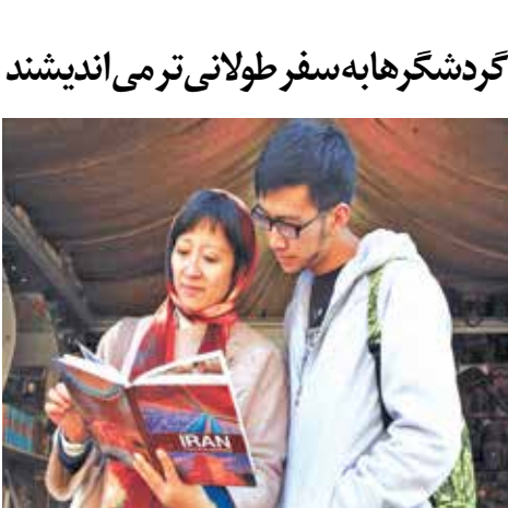
گردشگران ایرانی در حال بازدید از موزه خاورمیانه در آناتلیا، ترکیه

سال‌هاست این اماواگرها بر زمین گردشگری استان سنگینی می‌کند و هر استاندارد و شهردار و رئیس میراث و سایر مقام‌های مسوول هم که بر صندلی ریاست تکیه زده، انتقادی وارد کرده و پیشنهادی هم داده ولی این در سال‌هاست بر همین پاشنه می‌چرخد. حالا از اتاق بازرگانی خیر آمده که بخش خصوصی اصفهان قرار است "شرکت توسعه گردشگری" تأسیس کند تا درمانی نباشد بر همه زخم‌های کهنه گردشگری اصفهان. اینکه این شرکت بر کدام مدار و قانون می‌چرخد و شیوه همکاریش با حوزه دولتی استان به چه شیوه‌ای است، هنوز رونمایی نشده اما خبر رسیده که اولین اقدام‌س از ثبت شرکت، خرید یا اجاره هواپیمای اختصاصی برای اصفهان است.