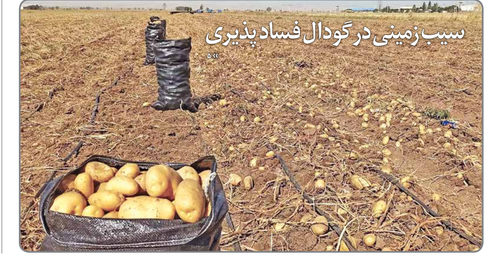
سبب زمینی در گودال فساد پذیری

دنیای اقتصاد: کاهش قابل تأمل تخلفات ساختمانی در مناطق ۱۵ گانه اصفهان در شرایطی از سوی مسوولان اعلام می شود که با نگاهی به ساخت و سازهای انجام گرفته در سطح شهر، با تعداد زیادی از تخلفات ساختمانی روبرو می شویم. اتفاقی که به نظرمی رسد به مانند یک عادت، بخشی لاینفک از فرهنگ ساختمان سازی شده است. در این حال، پیشروی این معضل در اصفهان نسبت به دیگر کلان شهرها کمتر و قابل قبول تر عنوان می شود. بنا به گفته مدیر کمیسیون ماده ۱۰۰ شهرداری اصفهان بیشترین پرونده های تخلف ساختمانی در این کلان شهر با سهم ۲۶ درصدی مربوط به اضافه ساخت مازاد بر پروانه است. باید گفت