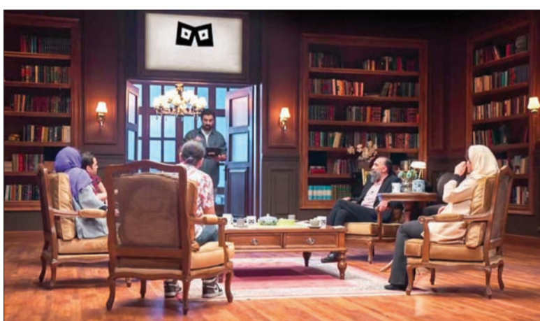
سری دوم رئالیتی شو «ناتو» با اجرای محمدرضا علیمردانی چه ویژگی‌هایی دارد؟ فصل دوم این مسابقه در پلتفرم فیلمنت منتشر می‌شود.

فصل دوم رئالیتی شوی «ناتو» در ادامه همان سری نخست ساخته شده. در هر قسمت چند شرکت کننده حضور دارند و در طول مسابقه ۱۰ پرسش سخت و گاه خنده‌دار توسط مجری از آنها پرسیده می‌شود و بازیکنان باید با هم به پاسخ درست برسند. از میان این بازیکنان، یک نفر نقش «ناتو» را بر عهده دارد. ناتو کسی است که جواب تمام سوالات را از قبل می‌داند. به غیر از بازیکنی که نقش ناتو را ایفا می‌کند هیچ‌کس حتی مجری برنامه، از هویت این بازیکن اطلاعی ندارد. شرکت کننده‌ها هم چهره‌هایی هستند که در اغلب برنامه‌ها و سریال‌ها دیده می‌شوند؛ مثل حسین مهری، ایمان صفا، کامران تفتی، امیرحسین مدرس، نصرالله رادش، هادی کاظمی، وحید آقاپور و... در قسمت اخیر اما شاهد اعضای یک گروه تئاتر کم‌دی بودیم که نتیجه کار آن‌ها مورد توجه برخی قرار گرفت و عده‌ای از کاربران به آن تقدایی جدی داشتند.