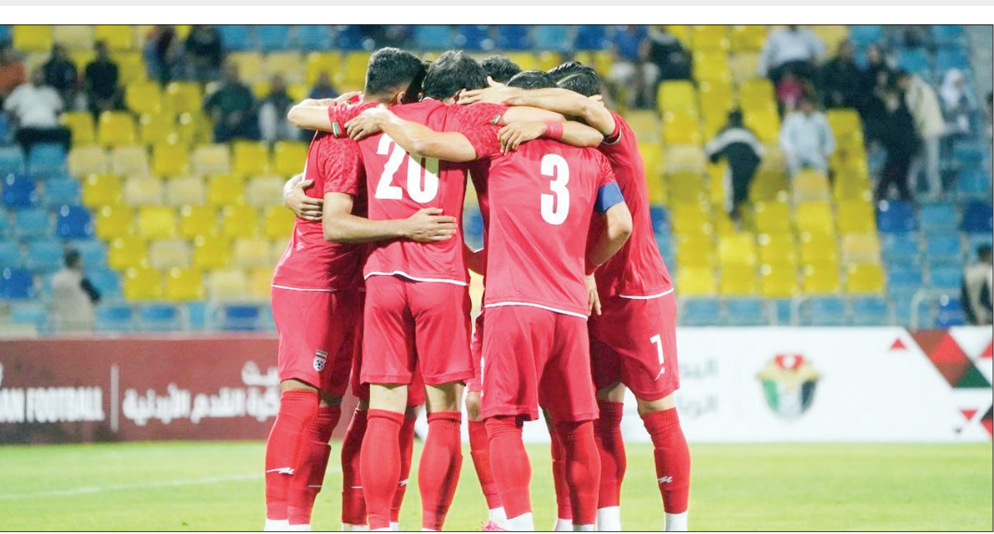
بازیکنان تیم ملی فوتبال ایران در حین جشن گرفتن پیروزی در فینال جام ملت‌های آسیا ۲۰۲۳

امیر قلعه‌نویی در حاشیه آغاز تمرین تیم ملی فوتبال ایران برای مسابقات جام ملت‌های آسیا ۲۰۲۳ گفت: گروه ما و تیم‌مدیریتی تیم ملی در تلاش هستند مردم را خوشحال کنند. خوشبختانه شرایط خوب است و نگرانی که به‌نظر ما شایسته بودند، انتخاب و دعوت شده‌اند او در واکنش به انتقادهای لیست نفرات دعوت شده به اردوی تیم ملی گفت: با توجه به اینکه زمان کمی برای جام ملت‌های آسیا داشتیم، پلن‌مان این بود که برای جام‌جهانی با شیب ملایم به‌سمت جوانگرایی برویم، با بازیکنانی که شایسته حضور در اردو بودند، ولی به‌قول شما هر لیستی بدهید حرف وحدیث ایجاد می‌شود. با توجه به محدودیت نفرات و انتخاب ۲۶ بازیکن، خیلی جلسات برگزار و لیست را بالا و پایین کردیم. قلعه‌نویی راجع به اردوی تیم ملی در کیش و دیدار تدارکاتی با بورکینافاسو گفت: بورکینافاسو تیم خیلی خوبی است، ولی دیدم برخی دوستان انتقادهایی کرده‌اند. این بازی می‌تواند محک خوبی برای ما باشد. دو برنامه و تاکتیک را می‌توانیم آزمایش کنیم و محکمی سخت و جدی هم بخوریم. قلعه‌نویی با تأکید بر حمایت‌ها از تیم ملی فوتبال یادآور شد: از همه خواهش می‌کنم حب‌وبعض‌ها را کنار بگذارند و از تیم ملی حمایت کنند. تیم ملی برای مردم است و امیر قلعه‌نویی اینجا میهمان است. یک روز قلعه‌نویی است، یک روز کی‌روش و یک روز هم افشین قطعی، مهم این است که با همدلی به تیم ملی کمک شود.