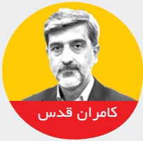
رئیس دانشگاه علوم پزشکی و خدمات بهداشتی درمانی استان سمنان از گرفتن چگونیز راه‌اندازی پارک علم و فناوری سلامت سمنان به‌عنوان یکی از بزرگ‌ترین کارهای انجام‌شده

از قرارگرفتن سه دانشمند این دانشگاه در جمع ۲ درصد دانشمندان برتر جهان به‌عنوان یک موفقیت نام برد و اظهار کرد: رتبه تحقیقات دانشگاه علوم پزشکی استان سمنان بین ۲۱ پانگاه جاده‌ای در مناطق تحت پوشش دانشگاه و یک مرکز اورژانس هوایی نیز تحت پوشش دانشگاه فعالیت دارد. این عضو هیئت علمی علوم پزشکی استان از بخش درمان به‌عنوان بهترین حوزه کاری در دانشگاه نام برد و افزود: عمده چالش‌های حوزه سلامت در کشور در همین بخش است.