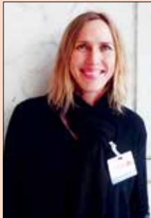
میر یام تیوز