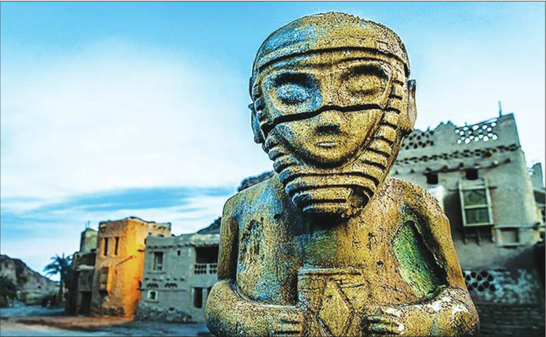
عکس: خورجری نسیم ۱

شهرک سینمایی نور یا پیامبر اعظم، بزرگ‌ترین شهرک سینمایی ایران است که در جاده قم احداث شده. این شهرک اولین بار برای ساخت فیلم محمد رسول الله به کارگردانی مجید مجیدی ساخته شد. شهرک سینمایی محمد رسول الله در ۲۵ کیلومتری قم و در حاشیه روستای الهپار واقع است. در این شهرک بخش‌هایی از شهرهای مکه، مدینه، شعب ابی طالب و کیلیسای بحیرا در شهر بصری شام در مقیاس یک یک ساخته شده است.