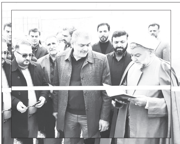
با اشاره به پروژه‌های افتتاح شده در شهرستان رباط کریم گفت: تلاش مسئولان شهرستان و مردم باعث شد تا در این ایام مبارک، شاهد افتتاح پروژه‌هایی باشیم که هر کدام از آنها در مناطقی از کشور رقم زند.

شهرستان، لیکن رضایت را بر لب مردم نشانده که این شادی موجب ارائه خدمات بیشتر مسئولان به مردم می‌شود. نایبی تصریح کرد: افتتاح بوستان دوستدار کودک، گلخانه، درمانگاه، جایگاه اختصاصی پمپ‌بنزین، و کارخانه صنعتی و تولیدی و دیگر پروژه‌های عمرانی، ورزشی، خدماتی و صنعتی در شهرستان رباط کریم هر کدام یک خدمات جدید را همراه با اشتغال‌زایی با ظرفیت بالایی را فراهم کرد. نایبی در پایان خاطر نشان کرد: اصل نظام مقدس جمهوری اسلامی ایران بر پایه مردم‌سالاری است و حضور و نقش هر فرد در هر انتخاب و تصمیمی برای آینده کشور مهم است و هر شخصی در آینده کشور سهمی است و با حضور در انتخابات و رای خود سهم بسزایی در آینده کشور دارد و همین حضور و حمایت شما مردم باعث شده است تا امروز ایران اسلامی در جایگاهی قرار گیرد که گزینه‌های تکراری روی میز دشمنان حذف شود و اقتدار ملی را برای کشور رقم زند.