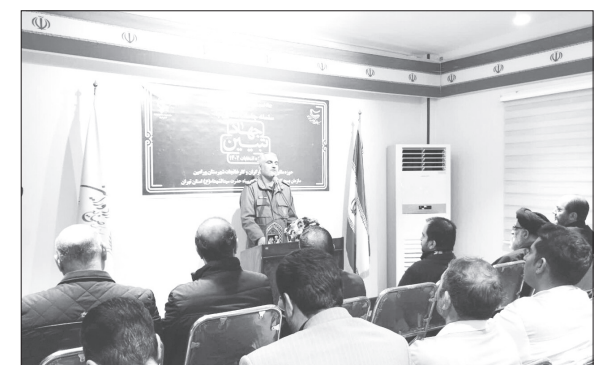
یکی از مهمترین دستاوردهای انقلاب اسلامی یاد کرد و اظهار داشت: امام راحل با انقلاب الهی خود و به پشتوانه حمایت‌های مردم نظامی و خواست و اراده مردم ساقط می‌شوند که البته این عهد الهی برای همه ستمکاران و ظالمان جهان است. وی از مردم‌سالاری دینی به عنوان