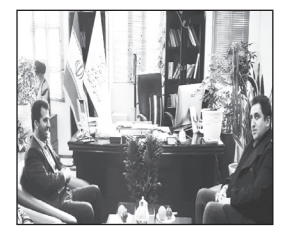
پیام سپیدار - پاکدشت برنامه دیدار و گفتگوی محمد مسگریان دستیار استاندار تهران در امر مردمی سازی با فاضل کارخانه فرماندار شهرستان پاکدشت در محل فرمانداری برگزار شد. فرماندار پاکدشت در این جلسه با اشاره به اینکه نظارت عمومی مردم بر امورات به بهتر شدن خدمات دولت کمک می‌کند گفت: برنامه ریزی‌های صورت گرفته تلاش می‌کنیم در اصول تصمیم‌گیری و تصمیم‌سازی، اجرا

و نظارت و بازرسی با هدف عملکرد مطلوب و حصول نتیجه بهتر در خدمت رسانی از حضور و نقش آفرینی مردم استفاده کنیم. فاضل کارخانه با اشاره به افتتاح ۱۲۰ پروژه در ایام الله ده مبارک فجر عنوان کرد: یکی از مولفه‌های جهاد تبیین، انعکاس خدمات نظام و دولت به مردم است و ما به عنوان مسئول وظیفه داریم که این خدمات را به مردم به بهترین شکل اطلاع‌رسانی و یادآوری کنیم. وی با اشاره به نقش مهم فعالان در امر انتخابات، تلاش در جهت مشارکت حداکثری و برگزاری انتخابات سالم و با شکوه با دعوت از همه فعالین سیاسی، نخبگان و همه مردم عزیز و فهیم را خواستار شد. مسگریان در این برنامه بر شناسایی سرحلقه‌های میانی و احصاء مسائل قابل حل توسط ظرفیت‌های مردمی، بسترسازی برای ارتقای جایگاه نظارتی مجموعه‌های مردمی، و... تأکید کرد.