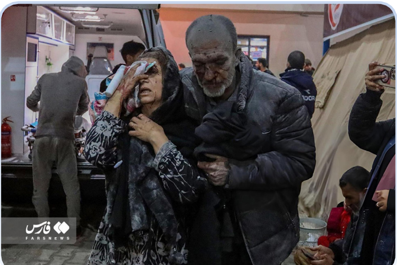
حملات رژیم صهیونیستی به رفح