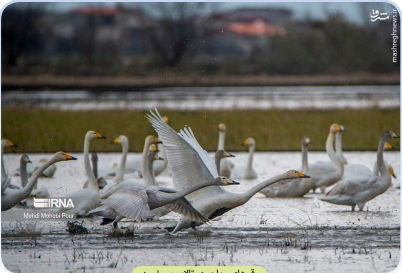
قوهای مهاجر در تالاب سرخ رود