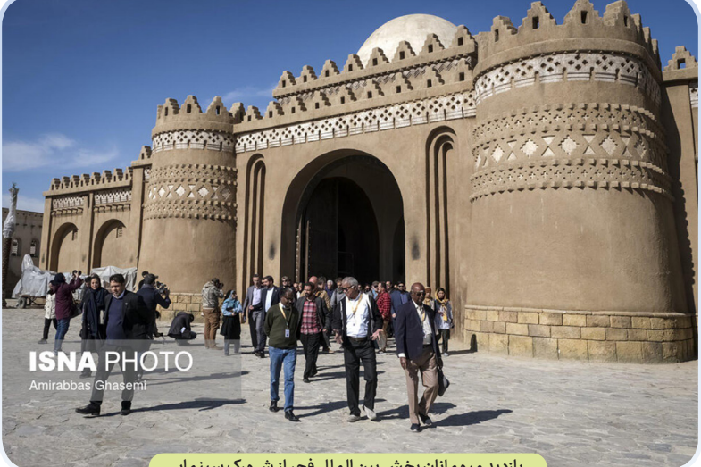
بازدید میهمانان بخش بین الملل فجر از شهرک سینمایی