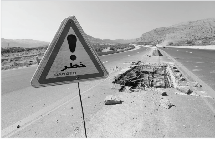
تصادفات فیزیکی جاده تصادفات رفتاری راننده