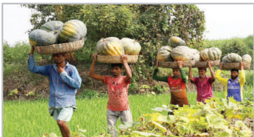
برداشت کدو تنبل از مزارع - بنکلاشد