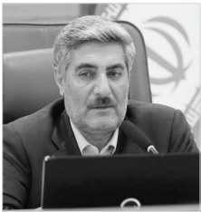
مدیرعامل آبفا شیراز:

واگذاری ۱۷۰ هزار مترمکعب پساب فاضلاب به صنایع