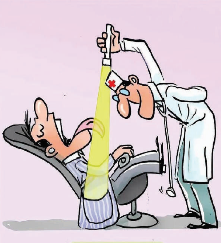
افزایش تعرفه ۴۶ درصدی تعرفه پزشکان