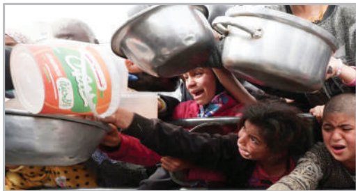
خطر شیوع قحطی گسترده - غزه