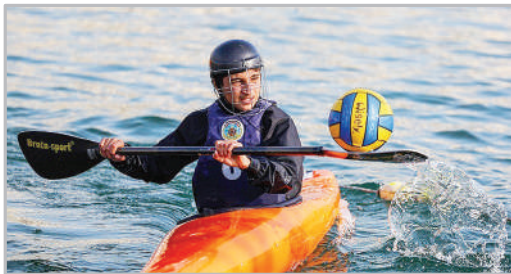
مسابقات لیگ قایق‌رانی کانویولو