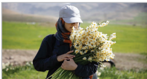
برداشت گل نرگس - شهرستان پلدختر