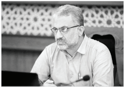
رئیس کمیسیون عمران شهرداری شیراز:

رئیس کمیسیون حمل و نقل و ترافیک و عمران شورا در پایان گفت: امید است این منطقه شهرداری در عملیات‌های عمرانی به سطحی از کیفیت برسد تا درخور مردم شیراز باشد.