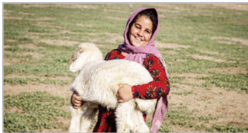
واکسیناسیون دام‌های عشایری - اهواز