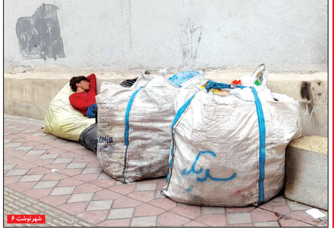
شهر نوشت ۶

جنان صفت: رانت موجود در عدم صدور مجوز واردات آیفون، «کورش کمپانی» ها را به وجود می آورد