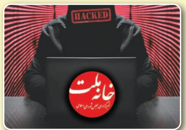
سایه برین روزنامه نگار

وی در پاسخ به اینکه چرا حقوق ۲۵۰ نماینده اعلام شد، گفت: عرض کردم که قرار بر این است که سخنگو اطلاعات دقیق را درباره این موضوع بدهند و همه می دانند که این عده‌های چند صد میلیونی دروغ است. حقوقی که به نمایندگان می دهند همان عدد ۲۷ تا ۲۵ میلیون تومان است، پول دفاتر هم که هزینه همان دفاتر است و خبر درست را سخنگو اعلام کرد. ما حاضر هستیم که شماره حساب خود را اعلام کنیم. وی ادامه داد: علت اینکه اسامی برخی از نمایندگان اعلام نشد، این است که حقوق شان را از نهادها دیگر مثل وزارت خارجه می گیرند یا عضو هیات علمی دانشگاه‌ها هستند. یوسفی درباره حقوق رئیس مجلس و اینکه از مجلس حقوق می گیرند یا سپاه یا دانشگاه تهران، نیز گفت: من که قالیباف نیستم، یوسفی هستم. به نظرم ایشان عضو هیات علمی دانشگاه هستند و از قدیم نیز از هیات علمی حقوق می گرفتند و از مجلس حقوق نمی گیرند.