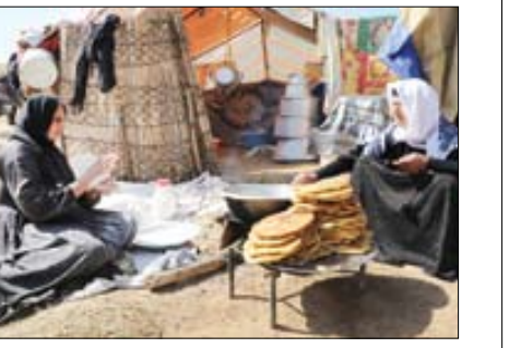
کارآفرینان با تسهیلات اقتصاد مقاومتی در استان‌ها به اشتغال‌زایی می‌پردازند