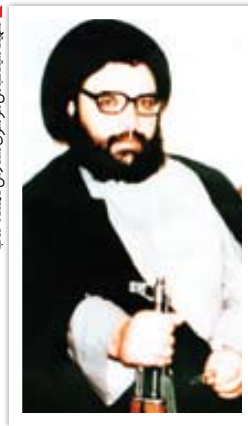
شهید سیدعباس موسوی سفارش کننده کتاب

سؤالات مهمی که با مد طرح شدند محمودزاده در ادامه این نشست بسیار کرد: بررسی وضعیت فعلی، سؤالات مهمی را قابل طرح می کند، شواهد بررسی های ۷۰ ساله نشان می دهند اسرائیل قصد صلح ندارد و منافق در جنگ است! سؤوال دیگر اینکه اگر هولوکاست درست است، پس چرا دوباره در حال تکرار شدن است و اسرائیل آن را تکرار می کند؟ وی در پایان گفت: برای جبران مافات و عقب ماندگی ها پیشنهاد تأسیس هلدینگ حزب الله و ارتش اسرائیل، عملیات «قانون و نظم ادبیات مقاومت را می دهد» ۲۲۰ زمان و کتاب عبری و انگلیسی که در برنامه این عملیات هست را جبران کنیم! پایان بخش این مراسم هم رونمایی از این کتاب ۳۳ ساله بود که ماجرایش را خواندید.