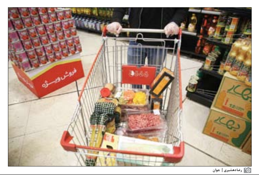
روزنامه‌شعری | جوان

سه‌گانه کالابرگ الکترونیکی، یارانه ارتقای امنیت غذایی کودکان (از ۶۰هزار تا یک‌میلیون تومان) و طرح «بیسنا» مربوط به مادان باردار یا دارای فرزند شیرخوار (۴۰۰هزار تومان) طرح‌هایی است که دولت برای افزایش ارتقای امنیت غذایی این آحاد مردم، کودکان تا ۹شاه و مادران باردار و شیرده به مرحله اجرا در آورد. هدف از اجرای این طرح‌ها، عدالت در سفره غذایی مردم بود تا بودجه تخصصی داده‌شده برای این کار، مستقیماً به میان سفره مردم بیاید. «طرح کالابرگ الکترونیکی» اولین اقدام دولت بود که آنها بنا داشتند از سال گذشته آن را به مرحله اجرا در بیاورند اما به دلیل آماده‌نبودن زیرساخت‌های مربوط به این کار، اجرائی شدن آن به سال ۱۴۰۲ موکل شد؛ ارزاقی امنیت غذایی مردم دام گام مثبتی بردارد. □ □ □