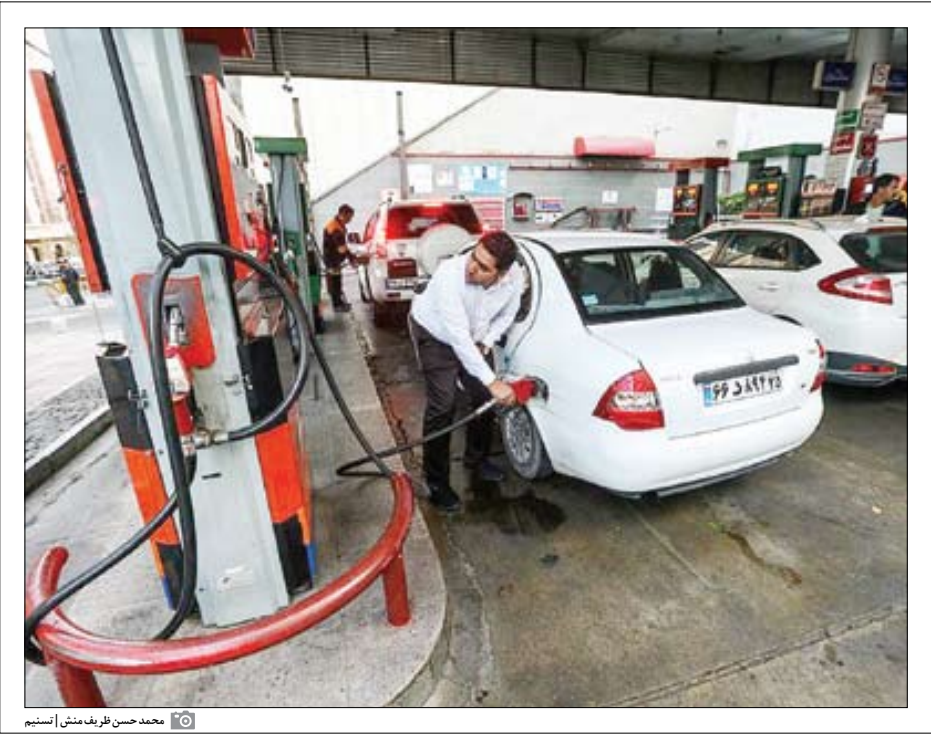
محمدحسن ظریف‌منش انستیم

برابر استاندارد جهانی مصرف انرژی دارند. این به معنای هدررفت بالای بنزین است که بر مشکل ناترازی دامن می‌زند. در لایحه بودجه ۱۴۰۲ دولت به پیش‌بینی هزینه بیش از ۳میلیارد دلاری برای واردات بنزین پرداخته است. به این ترتیب، در حالی که در سال ۱۴۰۱ صادرات بنزین داشتیم و کشور از حدود یک میلیارد دلار ارزآوری منتفع می‌شد، حالا به هزینه هنگفتی برای واردات بنزین نیاز داریم!» وی می‌افزاید: «اصلاح صنعت خودروسازی کشور فوریت دارد و باید در دستور کار قرار بگیرد. این اقدام حتماً به بهبود وضعیت ناترازی بنزین در کشور کمک می‌کند. اما این روش زمان‌بر است و نباید توقع داشته باشیم در کوتاه‌مدت شاهد تحولی عظیم در صنعت خودروسازی کشور باشیم.»