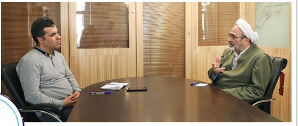
مجموعه‌های عالی جوان

بیانیه گام دوم انقلاب: هم آرمان‌های انقلاب را ترسیم کرده که در حقیقت مسیر رو به جلوی ما به سمت تحقق آرمان‌هاست و هم به آسیب‌شناسی روی آورده که چرا گاه این آرمان‌ها به نحو مطلوب تحقق پیدا نکرده است و هم مسیرهایی را که می‌تواند برای جوان امروزی ما صحنه واقعی و عینی کنشگری باشد، ترسیم کرده است