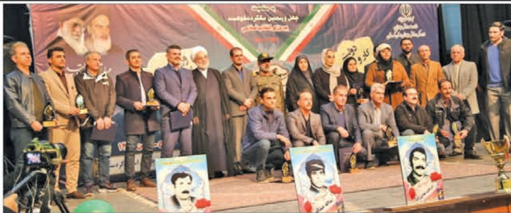
استاندار کردستان در جمع ورزشکاران!

مردم با هر سلیقه‌ای پای صندوق‌های رای حاضر خواهند شد / پرهیز از جانبداری اصل مهم حفظ سلامت انتخابات از سوی مسئولان است