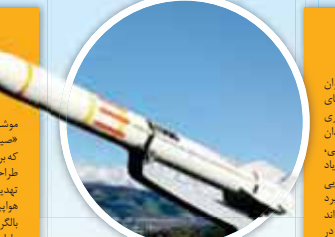
داری قابلیت درگیری همزمان با هدف

«آذرخش» به‌عنوان تازه‌ترین دستاوردهای متخصصان وزارت دفاع رونمایی شد. این سامانه پدافند هوایی است که می‌تواند با اهداف درگیر شده و تهدیدهای کاسابلومسی از ویژگی‌های مهمی است که اهمیت به کارگیری آنها در ساختار دفاع هوایی کشور را دوچندان کرده است. به گفته امیر محمد رضا ششپن، وزیر دفاع، سامانه «آرمان» که با نام و یاد شهید والاقوام «آرمان علی وردی» رونمایی شد، سامانه‌ای راه‌کنشی است که دارای برد متوسط و «از ارتفاع بلند» بوده و می‌تواند اهداف را در ۱۸۰ کیلومتری شناسایی و در ۲۰ کیلومتری با آنها درگیر شود و منهدم کند. گفته می‌شود این سامانه بسیار چابک است و در کمتر از ۳۰ دقیقه آماده سلاطه خواهد بود.