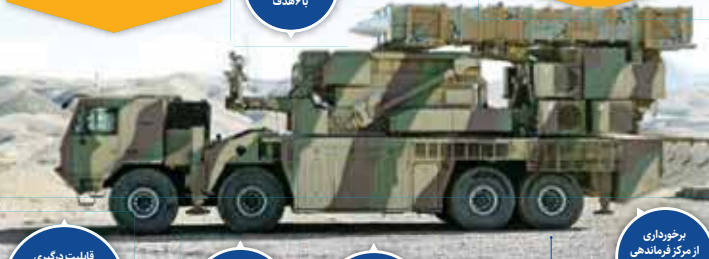
داری قابلیت درگیری همزمان با هدف

داری قابلیت درگیری با موشک‌های صیاد ۹۳۴ عمود پرواز است.