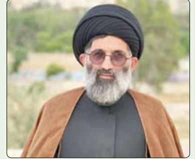
حجت الاسلام والمسلمین موسوی مطلق: بسم