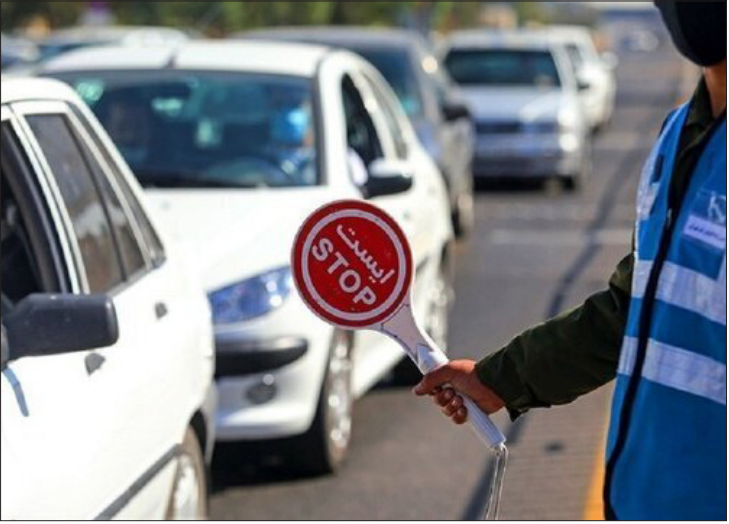
یک کارکن در حال کنترل ترافیک در بزرگراه آزادگان