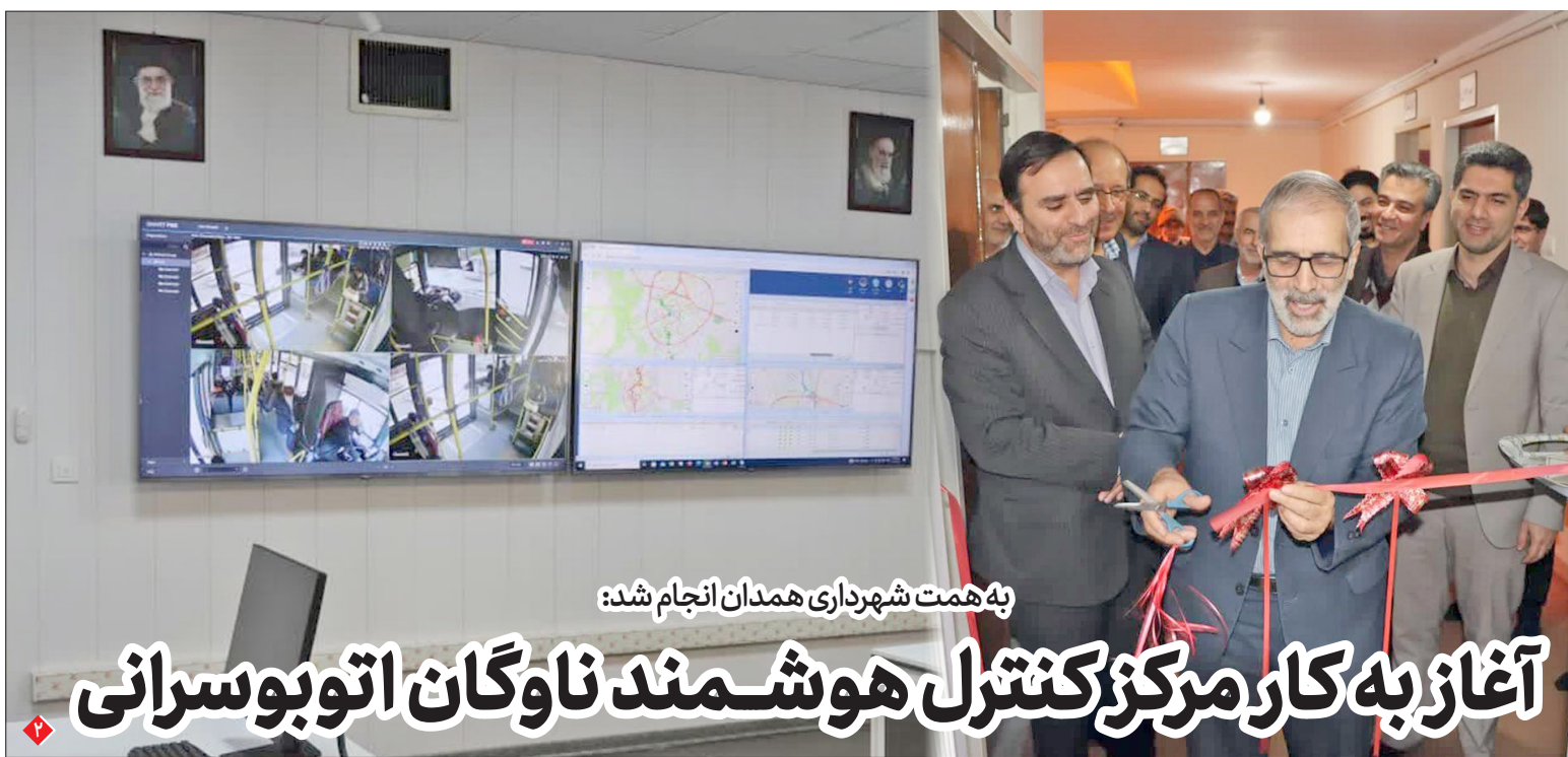
به همت شهرداری همدان انجام شد: