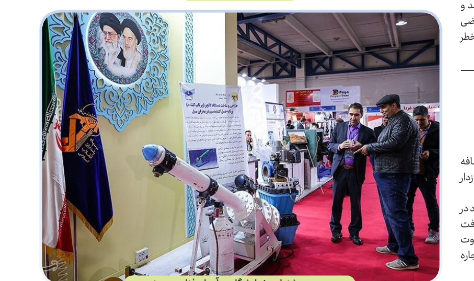
سومین جشنواره و نمایشگاه سرآمدان فناوری و صنعت