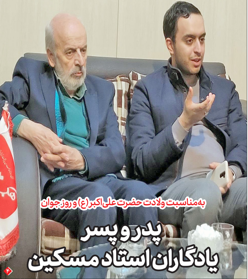
به مناسبت ولادت حضرت علی اکبر (ع) و روز جوان