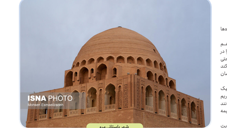
شهر باستانی مرو