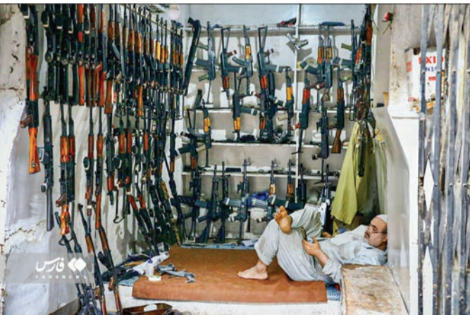
تمام ساکنان دره آدم خیل، روستایی در ناحیه کوهات واقع در استان خیبر پختونخوا (پاکستان)، به ساخت سلاح مشغول هستند.