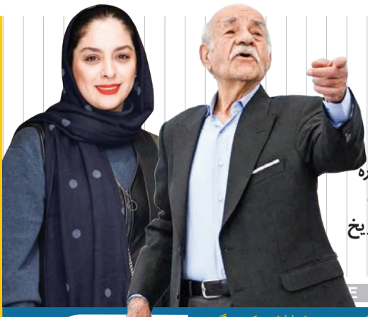
میلاد حضرت علی (ع) را تبریک می گویم

یکی از ویژگی های قابل توجه ترکیب فیلم های راه یافته به چهل و دومین جشنواره فیلم فجر، حضور پررنگ آثاری است که حداقل یک کاراکتر واقعی پر آمده از تاریخ معاصر، در روایت خود دارند... صفحه ۱۰