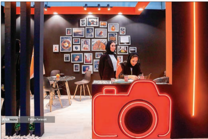
اولین نمایشگاه تخصصی اپلیکیشن (ایکس، APPEX ۲۰۲۴) با حضور علاقه مندان در محل دائمی نمایشگاه های بین المللی تهران آغاز به کار کرد.