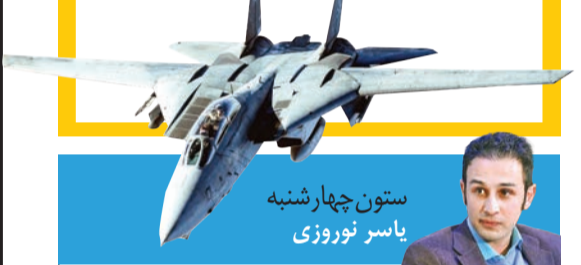
ستون چهارشنبه یاسر نوروزی

بهترین خلبانان ایران چه کسانی بودند؟ صفحه ۰۸