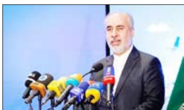
سخن‌گویی وزارت امور خارجه تاکید کرد:

سخن‌گویی وزارت امور خارجه تاکید کرد: از کان، مولفه‌ها و عناصر قدرت ملی، وابسته به یکدیگرند و پیشرفت و تقویت هر کدام از آنها علاوه بر تاثیر در دیگر مولفه‌ها، موجب تقویت کلیت نظام و جایگاه کشور در عرصه نظام بین‌الملل خواهد شد. کنعانی خاطر نشان کرد: دیپلماسی دفاعی با فعالیت‌ها و تلاش‌های متنوع، یکی از مهمترین ابزار دولت‌ها در راستای رسیدن به اهداف مطلوب بدون بهره‌گیری از نیروی قهریه نظامی است. وی ادامه داد: اقتدار دریایی جمهوری اسلامی ایران و نقش آن در صلح و امنیت منطقه‌ای و بین‌المللی، اکنون پشتوانه محکم برای دیپلماسی همسایه محور، متوازن و بویای دولت است و در عین حال نیروی بازدارنده در مقابل چالش‌گران متجاوز، طمع‌کار و بی‌منطقی است که سودای تعدی به منافع و امنیت ملی ایران و ایرانیان را دارند. سخنگوی وزارت امور خارجه تصریح کرد: هم‌اکنون وابستگی نظامی و دفاعی جمهوری اسلامی ایران در سفارتخانه‌های ما در تعداد قابل توجهی از کشورهای دنیا حضور داشته و عضو موثری از تیم دیپلماسی خارجی توسعه محور و صلح‌جوانه جمهوری اسلامی ایران به شمار می‌رود. کنعانی گفت: وزارت امور خارجه، سفرا و دیپلمات‌های جمهوری اسلامی ایران نیز با درک اهمیت دیپلماسی دفاعی همواره سعی نموده‌اند که موجبات انجام مأموریت موفق فرستادگان نظامی و دفاعی کشور را فراهم سازند