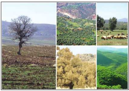
این رو مدیریت نظارت بر طرح‌های عمرانی مناطق نفت‌خیز به نمایندگی از شرکت ملی نفت ایران، همسو با طرح کمک و مشارکت برای اجرای

طرح‌های زیست‌محیطی صیانت از جنگل‌های زاگرس در سطح استان کهگیلویه و بویراحمد، مشارکت در تولید بیش از ۲ میلیون اصله نهال را در دستور کار قرار داده که تأمین‌کننده نهال مورد نیاز حدود ۱۰ هزار هکتار از اراضی جنگلی خواهد بود. از سوی دیگر این مدیریت به‌منظور تسهیل و ترغیب جمعیت منطقه، اقدام به ارائه گلدان پلاستیکی و بذر و پرداخت هزینه تأمین آب برای کشت و رشد نهال به زنان سرپرست خانوار منطقه کرده است تا به این وسیله افزون بر فرهنگ‌سازی، به دوستداران محیط زیست بیفزاید که استقبال خوبی از این موضوع شده و بیش از ۱۰۰ خانوار در این زمینه مشارکت کرده‌اند. با توجه به اینکه جنگل‌های استان کهگیلویه و بویراحمد در معرض آفت زغالی بلوط قرار گرفت، از این رو به‌منظور مبارزه با این آفت، همچنین غنی‌سازی جنگل، مبلغ ۱۰۰ میلیارد ریال به این کار اختصاص یافت که در همین ارتباط در سطح ۵۰۰ هکتار اراضی جنگلی آفت‌دیده محلول‌پاشی شد، همچنین کاشت ۱۵۰ هزار اصله نهال در مساحت ۶۰۰ هکتار از اراضی جنگلی در دستور کار قرار گرفته است.