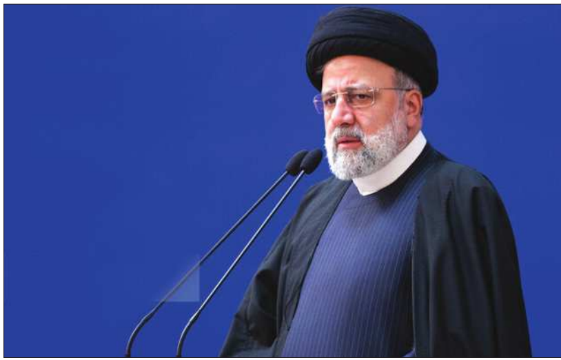
وی ضمن اشاره به بازدیدی که سال گذشته از پروژه آبرسانی منطقه درج در شهرستان سربیشه و مرود و تاکنون نیز در سطح کشور تنش آبی سه هزار