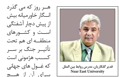
فدر کارگران، مدرس روابط بین الملل Near East University

برخی رهبران کشورهای عرب هم در تردید به ورود به بازی هستند و یا اینکه خود را به دور از گود تگه داشته اند. هنوز هیچ کشور سنی علی رغم تبلیغ علیه ایران و دشمنی با مذهب شیعه نتوانسته اند متحدانه بر علیه اسرائیل در راستای حمایت از هم کیشان و هم مذهبیان خود قدم بردارند. اگر هم بر می دارند فراتر از شعار و قطع نامه چیز دیگری نیست. همه آتشکار نهان با سرتنگین ارتباطات اقتصادی، سیاسی، اطلاعاتی دارند. بار سنگین