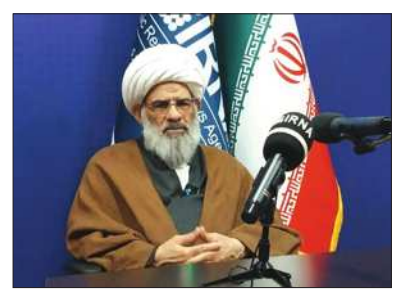
آیت الله علی ملکوتی تاکید کرد:

پشتوانه علمی و مردمی دارد و به صورت قانونی می تواند مشکلاتی از جامعه را حل کند لذا فضای بسیار صمیمی که در این مجلس با حضور افراد متفقد وجود دارد به تقویت انسجام و وحدت در میان خبرگان کمک می کند. آیت الله ملکوتی یادآور شد: اکنون در کمیسیون سیاسی، اجتماعی و فرهنگی و کمیسیون حراست و پاسداری از ولایت فقیه عضویت دارم، درم، در وقایع مختلف با دعوت مسئولین به دیگر کمیسیون ها نکت و نظرات خود را مطرح می کنیم و انصافاً مسئولان هم به موضوعات بی توجه نیستند. یادگار امام جمعه فقید تبریز با اشاره به نقش رسانه ها در مقابله با توطئه های دشمنان اظهار کرد: رسانه با توجه به تخصص خود می تواند نقشی بسیار مهم و تاثیر گذاری در این زمین بردن توطئه های دشمنان علیه کشور ایفا کنند زیرا جایگاه ارزشمند رسانه در عرصه اطلاع رسانی بر کسی پوشیده نیست و لذا پوشش خبری رویدادهای مختلف کشور باید به دور از جریانهای سیاسی و در مسیر حفاظت از اصول نظام و خط رهبری همواره مورد توجه آنها قرار گیرد.