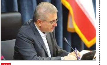
سندوق بین المللی پول: مقدار فروش نفت ایران فراتر از انتظارها بود

رئیس سازمان برنامه و بودجه دولت در لایحه بودجه از بیش بر آوردی منابع پرهیز کرد