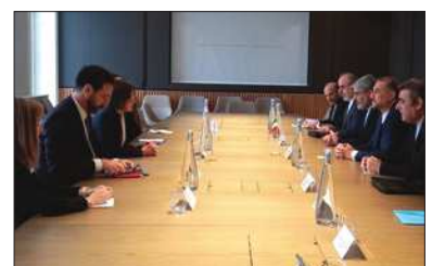
امیرعبداللهیان در ژنو:

خانواده های مفقودان، تداوم حمایت کمیته از روند تفحص را خواستار شد. اسپولیاریک، رئیس کمیته صلیب سرخ نیز در این دیدار با تشکر از تلاش های سیاسی جمهوری اسلامی ایران برای کمک به پایان جنگ، از وضعیت وخیم انسانی در غزه شدیداً اظهار نگرانی کرد. وی با تشریح تلاش های کمیته بین المللی صلیب سرخ در ارسال کمک و کاهش آلام انسانی ساکنان غزه گفت: تمام تلاش های خود را برای بسیج امکانات به منظور ارسال کمک های انسانی به غزه به کار می برد. رئیس کمیته صلیب سرخ با بیان اینکه متأسفانه جامعه جهانی نتوانسته است در این بحران از عهده مسؤولیت انسانی خود برآید، با تاکید بر ضرورت درک جهان نسبت به شرایط نگران کننده انسانی در غزه و عدم دسترسی ساکنان آن به آب و غذا و ی همچنین از عدم ابعاد این فاجعه را عمیق تر کند و ۱ میلیون ۴۰۰ هزار فلسطینی آواره و ساکن در رفح را با تهدیدت بسیار جدی مواجه کند. وی تاکید کرد: مقاومت در حوزه نظامی توانمند است و رژیم اسرائیل با تداوم جنگ چیزی به دست نخواهد آورد اما آنچه که موجب نگرانی است، وضعیت وخیم انسانی است. وزیر امور خارجه اسپولیاریک همچنین به شرایط نگران کننده انسانی در برخی دیگر از کشورهای منطقه علاوه بر فلسطین اشاره کرد و افزود: همه تلاش های خود را برای تماس و گفت و گو با تمام طرف های که از توان نفوذ برای مدیریت اوضاع برخوردار هستند، به کار خواهد بست.