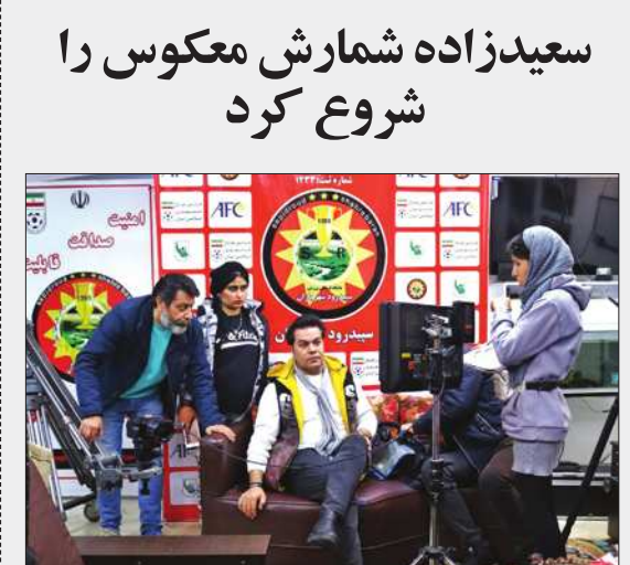
سعیدزاده شمارش معکوس را شروع کرد