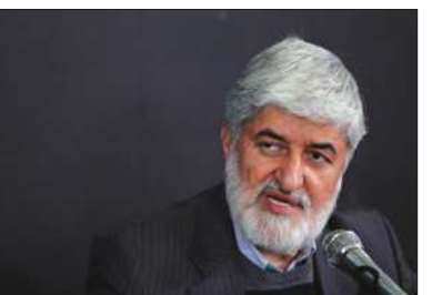
سرلیست فهرست صدای ملت گفت:

کاندیدای دوازدهمین دوره انتخابات مجلس گفت: در صورت پیروزی در انتخابات و راه یافتن به مجلس از مشاوران متخصص در حوزه های مختلف استفاده خواهیم کرد و قوانین غیر ضرور تنقیح خواهد شد و قوانین مورد نیاز و ضروری به تصویب می رسد. مطهری اظهار کرد: برخی از جریان های سیاسی گله مند هستند اما راه حلش تحریم انتخابات نیست، بلکه رای دادن به افراد معتدلیست که بتوانند در داخل مجلس اصلاح ایجاد کنند. به نظرم مردم به جای رای ندادن، به لیست صدای بگریه، مردم اصل انقلاب اسلامی که به تندرورها معترض هستند. وی ادامه داد: اصلاح زمانی می شود که حداقل ۷۰ کرسی مجلس در اختیار افراد معتدل قرار بگیرد. مردم اصل انقلاب اسلامی و جمهوری اسلامی را قبول دارند اما معتقد به اصلاح هستند. مطهری مشارکت ۵۰ درصدی مردم در انتخابات را خوب توصیف و پیش بینی کرد: تصور می کنم مشارکت در انتخابات بیش از ۵۰ درصد خواهد بود و همین برای اصلاح خوب است. وی گفت: هرگاه آمریکا حمایت تسلیحاتی و مالی خود از صهیونیست ها را برادر ایران نیز غزه کمک کنند. انتظار از حمایت نکردن ایران و سایر کشورهای اسلامی از مردم غزه انتظار بی جایست در حالی که هواپیماها و تسلیحات آمریکا هر روز به سرزمین های اشغالی پرواز می کنند و کمک های دولت آمریکا را به این رژیم غاصب می رسانند. مطهری اختلاف نظر در لیست صدای ملت را طبیعی دانست و افزود: افراد لیست صدای ملت بر سر حد متوسطی از امور توافق می کنند و این به معنای قبول داشتن ۱۰۰ درصدی آرا در جریان ما نیست.