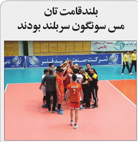
بلندقامت تان مس سونگون سر بلند بودند

مجلس خبرگان رهبری پشتوانه علمی و مردمی دارد