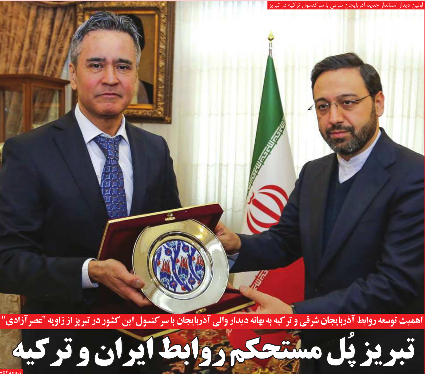
اولین دیدار استاندار جدید آذربایجان شرقی با سرکنسول ترکیه در تبریز