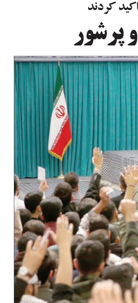
رهبر انقلاب در دیدار هزاران نفر از رای اولی‌ها و جمعی از خانواده‌های شهدا تاکید کردند

برگه رأی می‌نویسیم. بنابراین هر مقدری که ممکن است باید در این زمینه تلاش کرد.