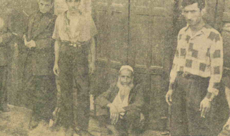
این پیرمرد هم از حمله اروباش مسموم نماید

انجمن گلیمیان هم که به خواب مرگ فرو رفته است، رئیس انجمن گلیمیان نیز به چاره حاضر نیست خود را کار کشیده و صدای انجمن را ترک نمیدوختن اسام این