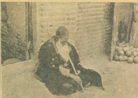
کسی هم فردنیسا پیدا میشود که بارنسنگین این مرد را سبک کرده و سرورسوتی بوضر زنده گیش بدهد؟

اطاقهای تیره و پراکنده آن که زمستان ها برف و باران از سقف آن بدون اطاق میبرود، و تابستان ها نور آفتاب از آن با داخل اطاق می آید و حتی از زندانهای ازمنه باستانی هم وحشت انگیز تر و رقت آور تر است. در داخل این اطاقها موجوداتی زندگی میکنند که با شبح بیشتر شهافت دارند تا انسان.