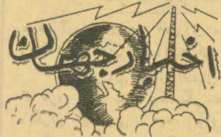
نیویورک: روزنامه نیویورک تاویل

اوضاع سیاسی واجتماعی فلسطین و ایسرائل در گذشته و حال