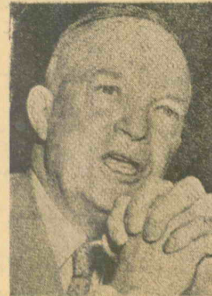
ایزنهاور کاندیدی ریاست جمهوری آمریکا