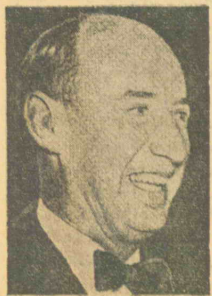
استیون نسون و قیب ایزنهاور

در این گیر و دار شورای عالی حزب وقف تشکیل گردید، و در باره فشار ژنرال نجیب دامن بر کناره گیری نحاس پاشا از راس حزب وقفه نظر کردی بعد از آنکه در تمام عموم افراد بر جهت حزب اعلام داشتند که وجود نحاس پاشا در حزب فتنه است و وی باید کماکان در راس حزب باقی بماند. بدینال این تصمیم، نحاس پاشا اعلامیه ای صادر کرد و طی آن خطاب بمردم مصر خاطر نشان نمود بقیه در صفحه ۴