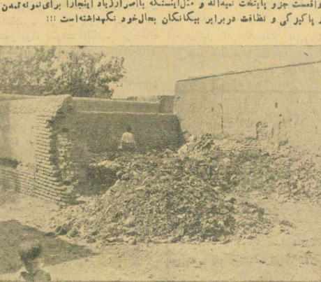
از این گسنگیها و شایه روزی مأمورین شهرداری منجله بهبودیان هر روز خرابتر از روز پیش میشود.

شهرداری تهران اساسا مثل اینستکه این نقطه شهر را که در قلب تهران واقعست جزو پایتخت نینماید و مثل اینستکه با اسرار زیاد اینبار برای نوله نهمین و پایگزین و پایتخت در برابر بیگانگان بحال خود نگهداشته است!!!