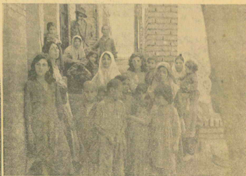
یک مشت زن و بچه بی پایه که مورد حمله چاقو کشان و ارادل قراو گرفته اند

هنکامیکه «دندان ویلکی» قنبد، رقیب روزولت رئیس جمهوری آمریکا در بیغوله جنگ بایران آمد و از نقاط مختلف پایتخت کشور شاهنشاهی دین کرد، پس از مراجعت با آمریکا کتابی بنام «یک دنیا» نوشت که ضمن آن مشاهدات خود را در کشور های مختلف جهان شرح کرده بود.