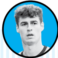
کیا آریزا بالاکا

ژاوی بعد از بازی با اوساسونا در مورد صحبت های کارلو آنچلوتی که در پاسخ به صحبت های او گفته بود به عنوان یک حرفه ای، هرگز دوست ندارد خودش را تا این سطح پایین بیاورد. گفت: «من فقط از داوران می خواهم که به ما اجازه دهند در لالیگا رقابت کنیم. کارت قرمز وینور رو که یک اشتباه دیگر علیه ما بود... یک اشتباه دیگر علیه بارسا. این واقعیتی است که همه می بینند.»