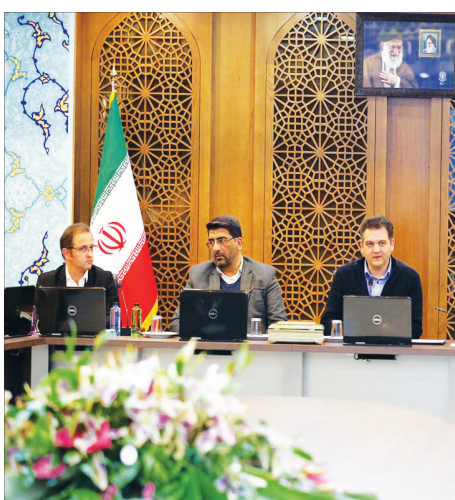
اصفهان همواره جزو استان‌های پیشتر است. وی ادامه داد: ضروری است در تولید محصولات نگاه صادرات محور وجود داشته باشد تا بتوان شرایط