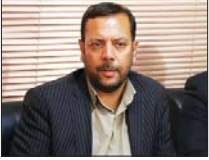
جانمایی ۱۵۰ مکان برای تبلیغات نامزدهای انتخاباتی