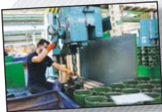
در صفحه ۴ بخوانید

اصلاح هندسی خیابان های منتظری و میرداماد در سده لنجان