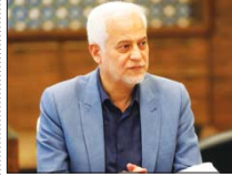
افزایش ۵۰ درصدی بودجه سال آینده شهرداری