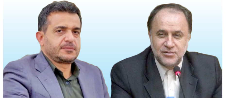
با حضور پرشکوه مردم در پای صندوق‌های رأی

احمدی و آریائی‌نژاد از ملایر به مرحله دوم راه یافتند