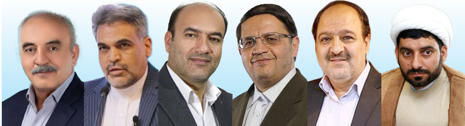
با حضور گرانبرد مردم در پای صندوق‌های رأی