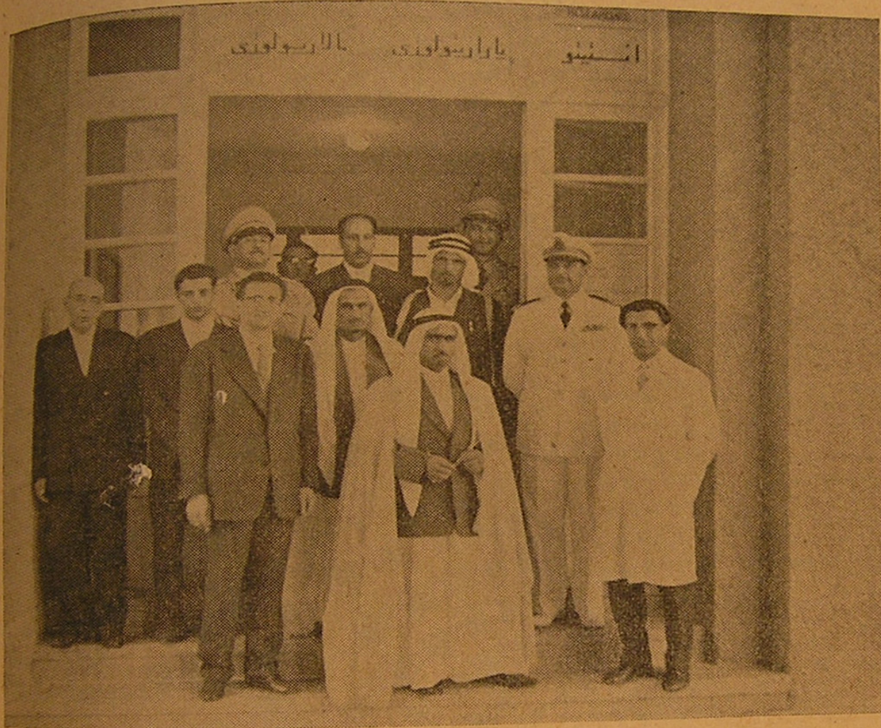
حضرت شیخ صقر بن القاسمی حاکم شارجه هنگام بازدید از انستیتو پارازیتولوژی و مالاریولوژی دانشکده پزشکی

ساعت شش بعد از ظهر روز چهارشنبه ۲۸ ر ۳۷ ر ۳۷ حضورت، شیخ صقر بن سلطان القاسمی