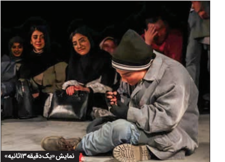
نمایش «یک دقیقه اثاثیه»

نگاهی به نمایش‌های روز آخر جشنواره تئاتر منطقه‌ای کشور که امروز در مشهد اجرا می‌شود