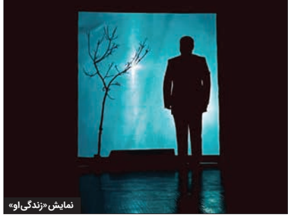
نمایش «زندگی او»