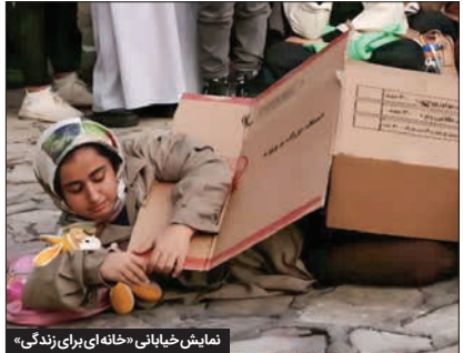
نمایش خیابانی، خانه‌ای برای زندگی