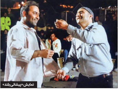
نمایش «بیشانی بلند»