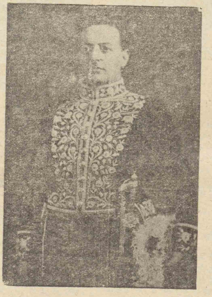
آقای فولادوند استانداری تهران

بر شیب عمارت استانداری تهران شکوه و جلال خاصی بخود گرفته بود و اشخاص در آن آمد و شد می کردند که شاید هیچوقت تا کنون در آنجا دیده نشده وجه بسا که اصلا نشانی استانداری تهران را نیز زحمت پیدا کرده بودند.