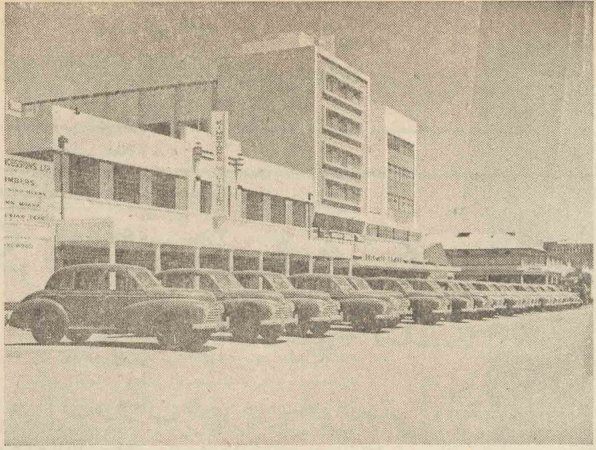
بگردید اتومبیلهای جدید مارک موریس که اخیراً به رودزی صادر شده است.