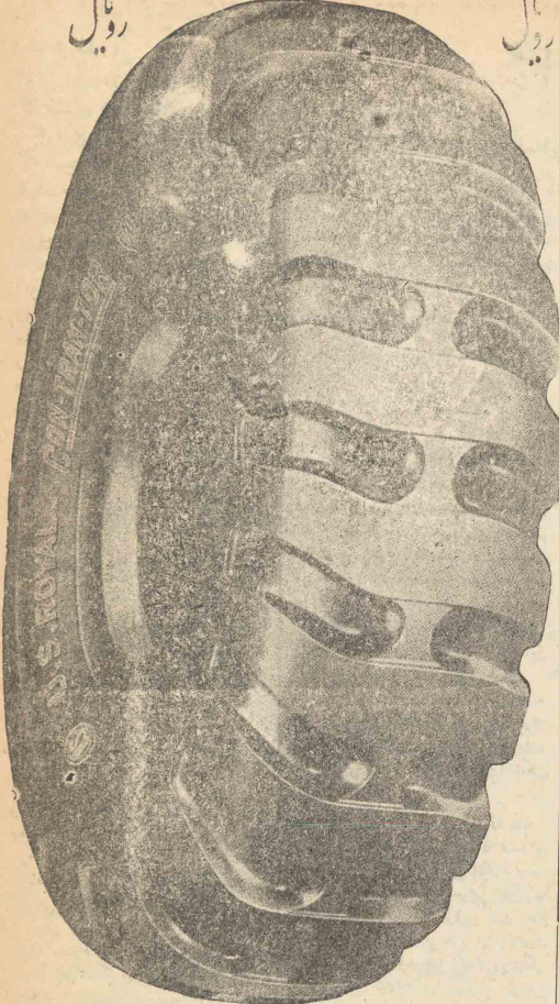
لاستیک رویال ونده ای ساخت جدید