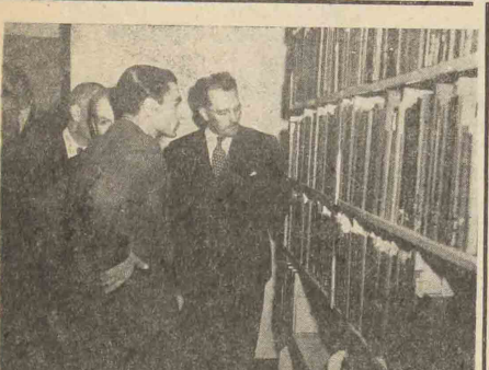
اعلیحضرت همایونی هنگام بازدید کتب نفیس کتابخانه دانشگاه برنستون