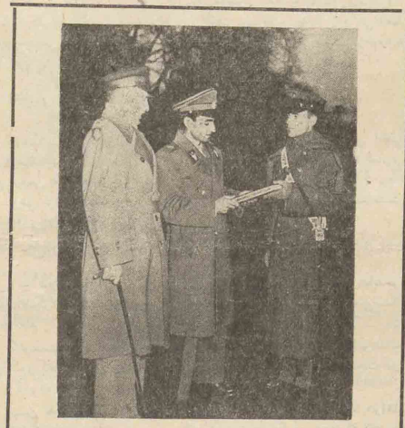
در دانشگاه نیروی نظامی آلبوم نظامی بحضور ملوکانه تقدیم شد

شهر قوچان در ۱۴۴ کیلومتری شهر مشهد قرار گرفته و دارای ۲۳ هزار نفر جمعیت می باشد در حالیکه جمعیت تمام ناحیه وسیع بزرگ قوچان از ۲۵۰ هزار نفر تجاوز مینماید. اکثریت جمعیت قوچان از ایل (زعفرانلو) که از طوایف مشهور ورشید کرد محسوب میشود بوده و بسی دسته تقسیم میشوند که مشهورترین آنها طوائف بقیه در صفحه ۲