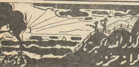
مشهد - ۴۹ -