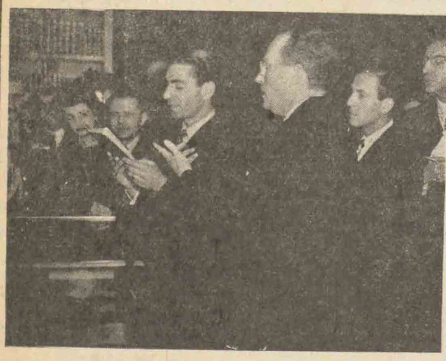
شاهنشاه در کتابخانه « برنستون » در دانشگاه برنستون یکی از نسخ نفیس دیوان عمر خیام را ملاحظه می فرمایند. آقای د شریونک و آقای علاء در طرف راست اعلیحضرت همایونی دیده می شوند

بیست و یکم آذر ماه، روز ارتش فدائی ما محسوب میشود، روزی که هر ایرانی وطن پرست و شاه دوست بی - اختیار بیاد فدائیان و شهیدان راه وطن می افتد. در این روز، ارتش ما جشن میگیرد و رژه میدهد، بی میکوبد، سرود میخواند، آهنگهای مهیج مینوازد. زیرا افتخار دارد که در راه ایران و برای نگاهبانی مرزهای همین عزیز سر می بسازد و تا کتون هزاران جان فدای این مرز و م نوده و با خون جوانان برومند و فداکار سرزمین ایران را آبیاری کرده است. اینها، این سر بزازان و افسران رشیدی که فردا از برابر صدها