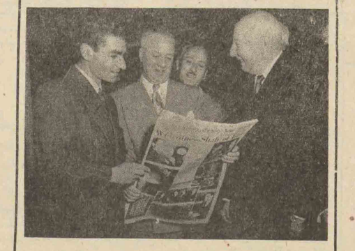
اعلیحضرت همایون شاهنشاهی از اداره روزنامه « نوارکابوینک یوز » باز دیدمی فرمایند

روزنامه تهران مصور در شماره اخیر خود پیامی را که اعلیحضرت همایون شاهنشاهی از آمریکا خطاب به ملت ایران فرستاده اند با این شرح انتشار داده است. از روزی که قدم ینک امریکا گذاشته ام دمی از یاد مبین مقدس و ملت عزیز خود غافل نبوده ام. در این مقامات آرزوی قلبی من این بوده است که از خدا توفیق یابم تا قسمتی از ترقیات امریکارا در وطن عزیز علمی سازم. از چهارشنبه باین طرف که وارد آریزونا شده ام بواسطه شباهتی که این سرزمین با ایران دارد بیشتر بیاد وطن بومدم. امیدوارم همانطور که مردم امریکا در نتیجه دانش و کوشش زمین های پهناور و بایر را سبز و حاصلخیز کرده اند مانند بوسایل فنی مبین خود را آباد و ساکنین آنرا خوشبخت سازیم. از خدا توفیق میخواهم. آریزونا - گرانده کانیون شاه