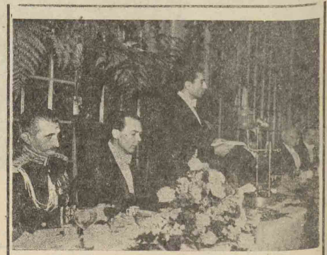
تیمار سپید بزبان بنا و آقای آن سفیر کبیر سابق آمریکا در ایران در دست راست اعلیحضرت همایونی دیده میشوند

از فرودگاه مستر ترورمن ریاست جمهوری آمریکا خیر مقدم اظهار کردند و اعلیحضرت همایونی نیز در پاسخ ایشان بیانانی در باره روابط دو کشور ایراد نمودند که در زیر متن اظهارات زمامداران دو کشور چاپ میشود. اعلیحضرت: بسیار خوشوقتم که بتاسبت نخستین مسافرتتان بختاک آمریکا خیر مقدم بکنیم. من مسافرت اعلیحضرت همایونی را بشکور آمریکا با مسرت تلقی نموده و اطمینان دارم که در مدت توقف در این کشور می توانید اطلاعات کامل از کشور مان تحصیل نمایند. همچنین اطمینان دارم که ما میتوانیم در مدت توقف اعلیحضرت همایونی در آمریکا اطلاعات کاملی از وضع ایران و عظمت تاریخ و فرهنگ کشور ایران و مسائلی که آن اعلیحضرت در دنیای جدید با آن مواجه شده اند، به دست آوریم.