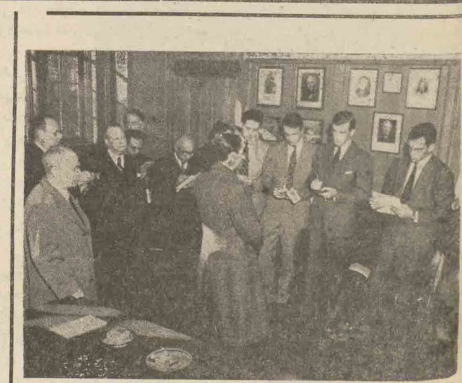
اعلیحضرت همایونی بشوالات خیر نگاران جواب میدهند