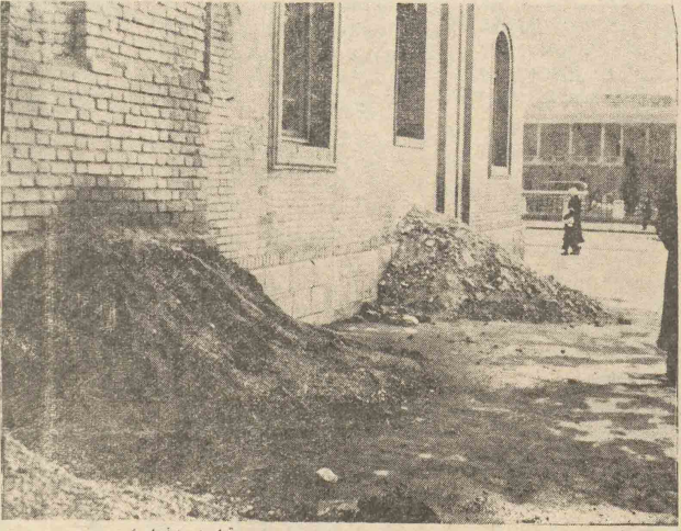
بقیه در صفحه ۴

دیروز ساعت یک بهما از ظهر از طرف برزن ۳ باشدت و خشونت با اداره مهر ایران تلفنی شده که خاکهای جلوی عمارت مهر ایران را بردارند. با ایشان جواب دادند که با چند نفر متظاهر کار قرارداد بسته شده در ظرف امشب تمام خاکها برداشته می شود. ولی فقط یک ربع از این تلفن گذشت که بیش از چهل نفر اعصاب بانام تجویزات از سه برزن شهرمانند فتنه استالینگراد بمبارت مهر ایران حمله کردند و خاکها را بیرون عمارت ریختند و چرا با این عمل اکتفاء نند دند بلکه سرسپور و چند نفر دیگر که کو با از طرف شهرهای معروف مخصوصاً داشته شروع به تهاش و توهن نمودند یکی از آن ها که می گفت مسئول یکی از برزن ها است بخیر نگار ما گفته بود آقای ابتهاج جواب مقالات ما را با بیل و کلنگ میدهند چون شما چند روز پیش نوشته بود چرا کانهای جلوی ایرونی شهرداری را ساختند چرا حالا جلوی آن دیوار می کشند باین جهت آقای ابتهاج بقیه در صفحه ۴