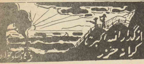
منطقه لطف آباد فصل دوم

اختلافات انگلیس و امریکادر مورد تحویل تجهیزات نظامی امریکابه اروپا مرفوع گردید