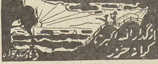
از گلزار گلزار خزر

بقلم ج. ه. سبسون مؤلف چند کتاب در باره تعلیم و تربیت مدرسه راگبسی که در دهستان لاردر یکشهر در انگلستان واقع است در سال ۱۸۷۷ توسط یکی از بزرگان میرلرنت نام لارنس شریف که میخواست وسائل تربیتی برسان زادگاه خود دمکده های مأمور آنرا فراهم آورد بنیان بگذارد. این مدرسه از جمله چند مدرسه است است که در انگلستان بنام مدرسه عرف و نحو نظیر دهستان معروفست و در عهد سلطنت ملکه الیزابت تأسیس شد و راگبی از میان همه مدارس مزبور باستانه یکی مشهور ترین میسرود. در واقع نام آن در سراسر دنیای انگلیسی زبان و سایر جاها معروفست و علت این امر تا اندازه ایه اینستکه راگبی صحنه و جلوه گاه داستان بزرگ مدرسه ایست بنام «ایام تعلیمی نام بران» که در نیم نوزدهم نویسنده انگلیسی توانس همز آنرا نوشته است. چنانکه معروفست (این کتاب دلیر آزاد رمان کرانیا) «علاقه عده کثیری از مردمان و برسان را بضرر جلب کرده بقیه در صفحه ۴