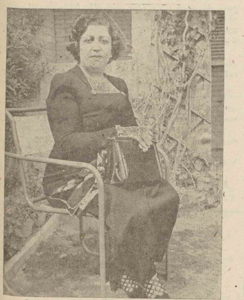
ملکه توکان در آبادان عکس دریاغ آقای غایب گرفته شد

متخصص بیماری های داخلی (کبد - معده - روده) و امراض مقاربتی معالجه کبد - درد استخوان و رماتیسم - ستابک - حسه - غش - قوار و ستوات و مسالیه قطعی سوزاک کهنه باجدید ترین دستگاہهای برق الکتریسیته - آدرس - خیابان فردوسی - مقابل کتابخانه مرکزی - پذیرائی صبح و عصر - شماره ۳۲۷۳