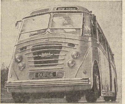
در نمایشگاه موتور که این ماه در شهر نیویورک دایر است این اتوبوس لوکس انگلیسی که چادر و راحت است جلب توجه کبلیهای حدها و نقل امریکائی است

در این ن اعلی حضرت پادشاه افغانستان پس از مراجعت از مجلس شورای ملی از خیابان شاه آباد لاله زار خیابان سی و از آنجا به سفرت اماستان تشریف فرما شدند ... مهر روز گذشته علیا حضرت ملکه ثریا پانچان مله حضرت ملکه جلوی مریدخانه نسوان تشریف فرما گردیدند و کلیه موصلات را بارید فرمودند. ... نظر اینکه اساتذات بانک ملی در هیئت وزراء تحت مطالعه میباشد (سیو لندن بلات) مشغول تهیه مقدمات فسخ بانک برآمده و مسائل ده هزار تومان که تازه تاسیس استرالیا بجهت بکیرد بقیه در صفحه ۴