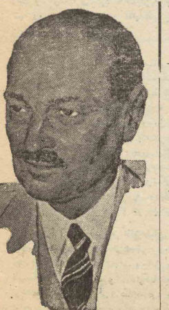
پیام مستر اتلی با ستیرلیا در صفحه ۴ بخوانید

بزرگان زن بناوت روروات همسر رئیس جمهور فقید آمریکا در استقبال در پاسخ بروز نامه نگاران زن داشت بفرموده من بزرگترین زنی که تا بحال ملاقات کرده ام بانو پانددت خواهر نخست وزیر هسو سفر گیر آن دولت در وانگتن میشود.