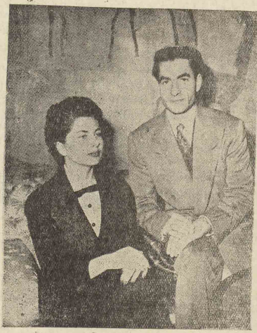
امروز مصادف با شصتین سال ازدواج فرخنده اعلیحضرت همایون شاهنشاه و علیاحضرت ملکه نریا پهلوی است. به همین مناسبت ما امروز یکی از زیباترین عکسهای شاهنشاه و ملکه را بخوانندگان عزیز مهر ایران تقدیم می‌کنیم.

پس ما علی‌الاصول با این قرضه از خارجی موافقت نمائیم یا این شرط که تمام این پولها از يك سنت تأمینونها دلار بخریم کارهای عمرانی و بالا بردن سطح زندگی عمومی و تأمین خوشبختی و سعادت مردم گردد.