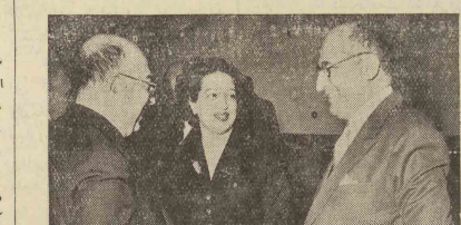
آقای وزیر امور خارجه در حال گفتگو با آقایان وزیران و رجال حضور یافته بودند.

کرده و (گاه نو) هکت تغییر و تغییر های مکرر قوانین را یاد آور شده داستان مردی که به موجب قانون ازین شد و عمل جراحی لازم آمد - بعقیده تهر ان مصور با این ترتیب از این بی تریبی جلوگیری خواهد شد - ایران ما میبوسد این وضع قابل دوام نیست و طلوع پاسختی دندان شکن میدهد - داستان بوسه از استاد شهباز در ص ۴