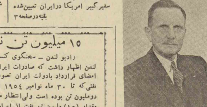
آقای هومز سفیر کبیر جدید امریکا در ایران

واشنگتن - جولیس هومز که از طرف برزبانت از اینها برست سفیر کبیر امریکا در ایران تعیین شده بقیه درصفا ؟