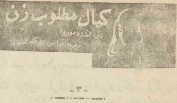
کمال مطلوب زن