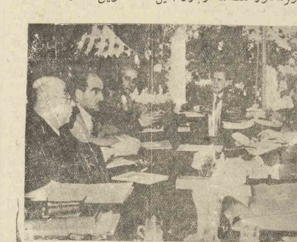
در کارور بالا از راست چپ آقایان دکتر مهران، مهندس اشرافی، دکتر صالح، سپهبد هدایت وزیر جنگ، هدایت معاون نخست وزیر، علاء تقصیر وزیر معنی، دکتر امینی، مهندس طاقانی و بنای در جلسه دیشب دولت دیده میشوند.

در جلسه دیشب هیئت دولت لایحه تشویق صادرات مطرح شد کلاهای صادراتی از پرداخت کلیه عوارض معاف میشوند در کرایه حمل و نقل کلاهای صادراتی تا ۷ درصد تخفیف داده میشود در جلسه دیشب وزرای راه - اقتصاد دارائی و مشاور امامور مطالعه درباره آیین نامه تشویق صادرات شدند