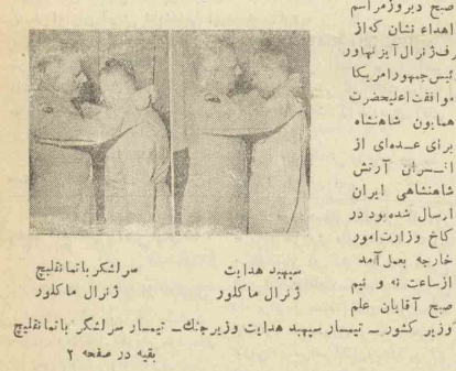
سپهبد هدایت ژنرال مالکوف رئیس ستاد ارتش ایران اسرار شده بود در کمال وزارت امور خارجه عمل آمده است و تیم و زبانه آقایان علم و وزیر کشور - تیمار سپهبد هدایت و وزیر جنگ - تیمار سرلشکر بانامانچلیچ بقیه در صفحه ۲

اهداء نشان از طرف رئیس جمهور آمریکا بهفت نفر از افسران ارتش ایران