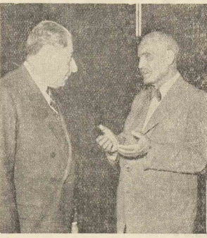
تابلونی از وحدت مجلسین...

منون در چند ماه اخیر برای حل اختلاف آمریکا و چین کونیت فعالیت بسیار زیادی مقبول داشته و بر اثر اقدامات او چین کونیت چندی پیش چهار نفر از خلبانان آمریکایی را آزاد کرد. کریشناسان چندماه قبل بنا به دعوت جونی لای نخست وزیر چین کونیت بکن رفت و مدتی راجع بمسائل مربوط بقشار دور و انجام مذاکره بین آمریکا و چین کونیت باوی تبادل نظر بعمل آورد. چون لای در کنفرانس کشور های آسیائی و آفریقائی که در هانویونگ (فونویزی) تشکیل شده بود اعلام کرده که حاضر است با آمریکا برای حل مسئله فوریز مستقیماً وارد مذاکره شود. اما این امر روسدای زیادی در جهان براه انداخت و دولت انگلستان به ژولیان کاردار سفارت گبرای خود درکنین دستور داده که در باره این موضوع از جونی لای توضیحاتی بخواهد و بعداً نیز بر اثر مکاتباتی که از طرف انگلستان بین آمریکا و چین کونیت صورت گرفت طریقین رسماً آمادگی خود را برای انجام مذاکرات مستقیم با بکنبر اعلام کردند و این موضوع یک هفته قبل در یک زمان در بکن واشنگتن اعلام گردید و نمایندگان طریقین بطرف ژنور هسبار شده.