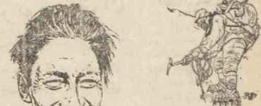
سومین گشت آه اورا میگوئی واقعا مثل اینکه سه روز دارد و گفتم که در یک ارتزاع مود استه فرار میدهم.