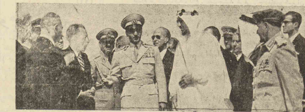
شاهنشاه نخست وزیر و روسای مجلسین در باعلیحضرت ملک سعود معرفی میفرمایند

وزیر کشاورزی اجازه کرج چون معنی ادوار نخانه ها برای اجرای بارهای پروژه احتیاج به اعتبار داشته و از طرفی تقاضا داشته که از محل اعتبار ۳۰ میلیون دلار اعتبارات برای آنها منظور شود همین جهت از طرف بقیه در صفحه ۴