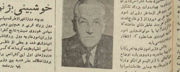
آخرین اخبار جهان

خوشبینی بژنو در چند روز اخیر از طرف سیاستمداران دول بزرگ غربی و همچنین دهربران سیاسی هوروی نسبت به نتایج کنفرانس وزیران امور خارجه دول بزرگ اظهار امیدواری شده و بعضی از ناظرین سیاسی اظهار عقیده کرده اند که اگرچه دوروزهای اول این کنفرانس برانی بروز اختلاف نظر شدید بین وزیران بقیه در صفحه ۴