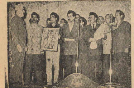
کراوز نوق مربوط بچشم بازدمه بهمین است که دیشب از طرف زندانیان بشیدان توده ای در زندان موقت شهربانی کلیر گزارده شد.

وا بازی می کنند که این دانشگاهها و کالجها برای تدریس در هر رشته و سالار کانی اقتصادی - مهندسی - بهداشت - صنایع - امور مربوط بکارگران - امور اداری فعالیت های بانوان و غیره میباشد. از سال ۱۹۵۱ تا ۱۹۵۵ ۲۱۷ نفر ایرانی برای تکمیل معلومات خود طبق برنامه اصل چهار با امریکا بزم کرده و در دانشگاهها و دانشکده های مختلف مشغول تحصیل شدند. قسمت اعظم این عده تا کنون با ایران برگشته و هر کدام در رشته خود انجام وظیفه می نمایند. در این برنامه کالج مارون دانشگاه های که در امریکا معروف به دانشگاه (پنی) و دانشگاه کالج هالیوکه دولت امریکا زمین جهت آزمایشها و تعلیمات کشاورزی در اختیارشان گذاشته است. هفت برتری