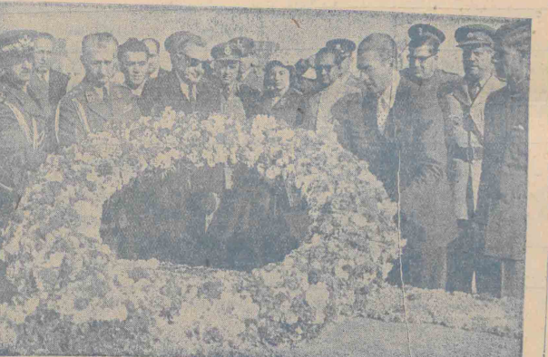
شاهنشاهی حلقه کل بسیار زیبایی به آرامگاه کانندی شاد نمودند

مجلس شایسته جمعیت علماء هند که در آرامگاه استقبال فرمودند. مجلس شایسته جمعیت علماء هند که در آرامگاه استقبال فرمودند. مجلس شایسته جمعیت علماء هند که در آرامگاه استقبال فرمودند.