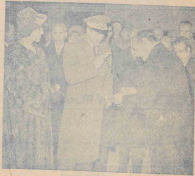
مکانیکه شاهنشاهی و ملکه خاتمه و طاقان ترک فرود آمدن شاهنشاهی در مشهد تلف فرادانه و نایب رئیس مجلس شورای ملی با کلاه لاله میباید به حضور ملوکانه اهداء نمود