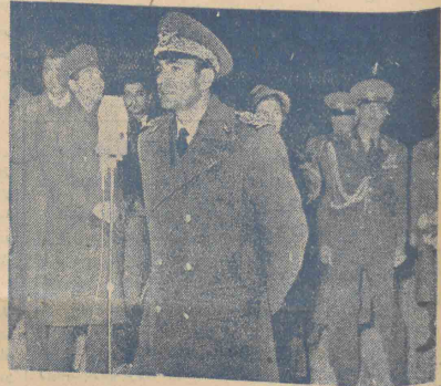
شاهنشاه قبل از ترک خاک وطن بیایه بلیت ایران ایر افراده نمودند

طبق تلگراف خیرنگار ما از بندر پهلوی سرگرد گوزنتشف و همراهانش دیر روز با کشتی «پیونر» برای همیشه خاک ایران را ترک گفتند- استوار رجائی در بازجویی مطالب دقیقتری را فاش کرده و کلیه منازل و محلهای را که مورد استفاده جاسوسان شوروی بوده بهامورین نشان داده است