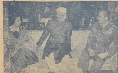
شاهنشاه و ملکه در شباهت رئیس جمهور هند