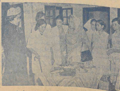
علیاحضرت ملکه هنگام بازوید آموزشگاه پرستاری هند که یکی از بزرگترین آموزشگاهها هه بود عه دوسراسر آسماحت