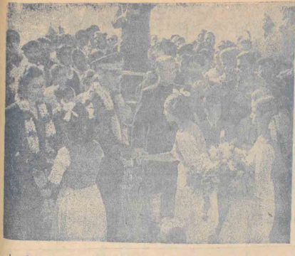
اعلیحضرت و فرودگاه (پایان) از طرف حضرت راجندرا پراساد رئیس جمهور هند و جواهر لعل نهرو نخست وزیر هند و وصال آن کشور نمود استقبال فرار کردند و نوبه تکی به گردن میبایند هند و وصال آن کشور نمود در این جا یکی از باوانان هندی شاهنشاهی می نمود

بر مبنای عدالت اجتماعی قرارداده باشد و البته لایحه دیگری که تکلیف ملکیت همه در روغن می کنده موضوع بوجهی ملکیتی است که مطابق قانون اساسی ملکیت هر مال قبل از پایان دوره تیراز پایان سال یا به تصویب هیئت قانونگذار رسیده باین امده و به مسافرت می رود و همه را بصدای متوال می سپارم و در هر جا که باشم از دور برای آن ملکیت کین و در جزیره دها خواهم کرد. آنگاه کاردار مخابرات هند بایانی ایراد نمود و اعلیحضرت پاسخ فرمودند: خوشبین هستم من است باین مسافرت خودمان بهند ایستادیم و خوشبین هستم دوستی و صمیمیت بین دو ملت ایران و هند از قرنهای پیش وجود داشته و در هیچ وقت قطع نشده است.