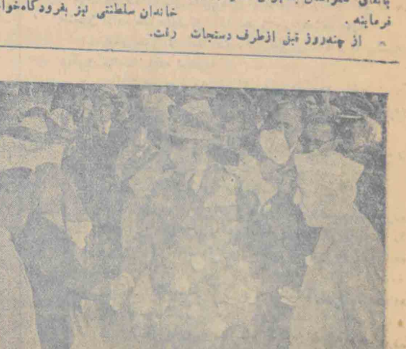
نهر اهالی کایت خود را بعضور شاهنشاهی معرفی میکنند

فرد است مقارن ۲۵ به امروز طبق برنامه اعلیحضرت مهابوی با نایب مهران بطهران مراسم فرمائید. از حضور تین از طرف دستجات