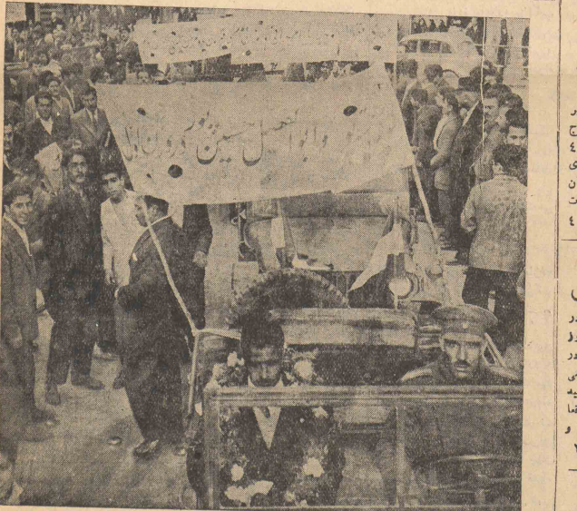
دیر روز تهرمانان ایران در میان استقبال پرشور اهالی بانیخت وارد تهران شدند

طرح لایحه بودجه در این وقت لایحه بودجه کل کشور مطرح و گزارش کمیسیون بودجه فراموش شد. بقیه در صفه ۴