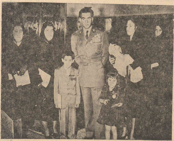
شاهنشاه از بازماندگان افسران شهید دلجویی فرمودند